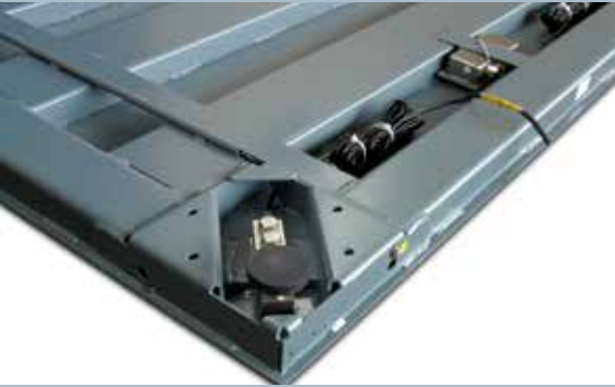
Alloggiamento cella di carico (particolare)